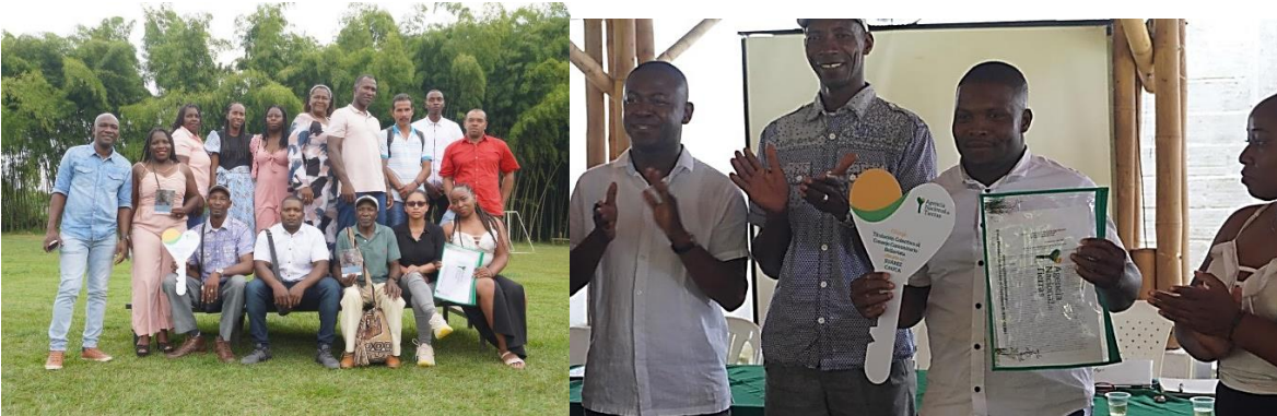
Entrega de la resolución de titulación colectiva del Consejo Comunitario Bellavista (Suárez, Cauca).

El predio Risaralda es utilizado por el Consejo Comunitario para el desarrollo de actividades agrícolas, principalmente para el cultivo de café, plátano, frijol, tomate y frutales. Las áreas con vegetación arbórea alrededor de la cañada, son conservadas por la comunidad, la cual proyecta ampliarlas para la protección de la fuente hídrica.